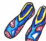
boty do vody